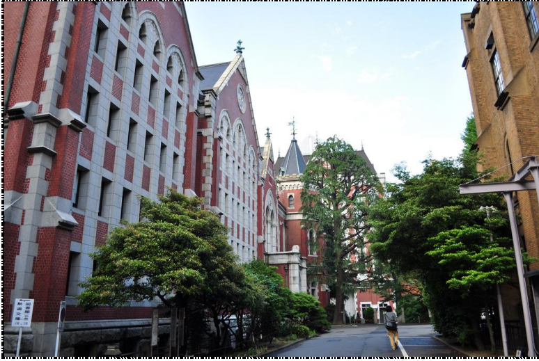
دانشگاه کیو (میزبان کنسرسیوم وب جهانی در ژاپن) W3C / Keio

Copyright © W3C® (MIT, ERCIM, Keio) & MW (WebMasterpiece) reserved.