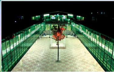
Soora Gool Hall