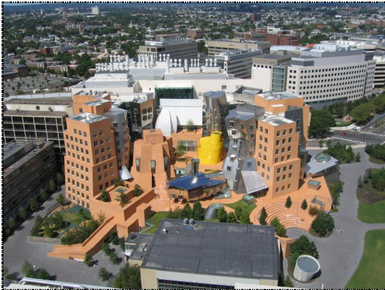
انستیتو فناوری ماساچوست (میزبان کنسرسیوم وب جهانی در آمریکا)

کنسرسیوم وب، ساختار سازمانی واحدی ندارد، یعنی به هم پیوسته نیست و از طریق پیمانی مشترک میان سه نهاد میزبان (MIT، ERCIM و دانشگاه کیو)، اداره می‌شود. تیم برنرز لی، در اکتبر سال ۱۹۹۴، کنسرسیوم وب جهانی (W3C) را در انستیتوی فناوری ماساچوست، لابراتوار علوم کامپیوتر [MIT/LCS] ۲۰ با همکاری CERN، که وب از آنجا سرچشمه گرفت، و پشتیبانی از طرف DARPA (آژانس پروژه‌های پژوهشی پیشرفته‌ی دفاعی ۲۱ ) و کمیسیون اروپا ۲۲ ، بنیاد نهاد.