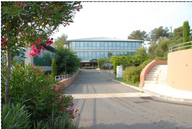
کنسرسیوم پژوهشی انفورماتیک و ریاضیات اروپا (میزبان کنسرسیوم وب جهانی در فرانسه) W3C / ERCIM

در آوریل سال ۱۹۹۵، INRIA (موسسه‌ی ملی پژوهش در علوم کنترل ۲۳ و کامپیوتر فرانسه ۲۴ ) نخستین میزبان اروپایی W3C شد، و پس از آن دانشگاه کیوی ژاپن ۲۵ واقع در آسیا در سال ۱۹۹۶ میزبان آن شد. در سال ۲۰۰۳، ERCIM ۲۶ (کنسرسیوم پژوهشی انفورماتیک و ریاضیات اروپا) میزبانی W3C در اروپا را از INRIA تحویل گرفت.