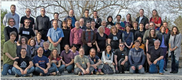
تیم کنسرسیوم وب جهانی (W3C) - (مارس سال ۲۰۱۰ میلادی)

رئیس W3C (آقای تیم برنرز لی) و مدیر اجرایی ارشد (CEO)، توافق آرا را برای تصمیمات گسترده‌ی W3C ارزیابی می‌کنند.