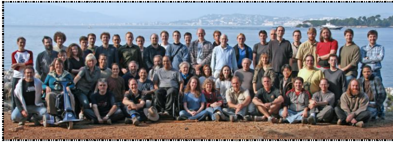
تیم کنسرسیوم وب جهانی (W3C) - (۲۵ اکتبر سال ۲۰۰۸ میلادی)

تیم W3C به مجموع پرسنل کنسرسیوم وب یعنی بسیاری از کسانی که در یکی از سه نهاد میزبان کار می‌کنند گفته می‌شود، همچنین تیم W3C شامل همکاران «کارمند (سازمان‌های) عضو آمیخته با پرسنل کنسرسیوم وب ۲۸ » (W3C Fellows ۲۹ ) می‌باشد.